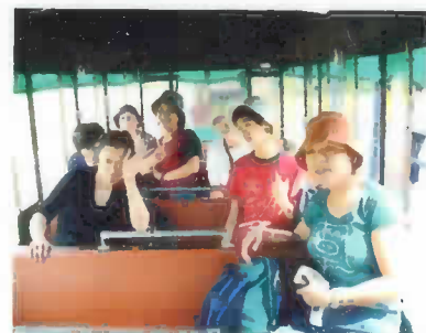
▲メルヘン号でルンルン▲