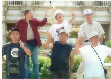
▲たんぼぼの晴れ男たち▲

ちよっぴり怖いアトラクションにチャレンジした班、素敵なショーを見た班、大きな観覧車に乗った班もありました。